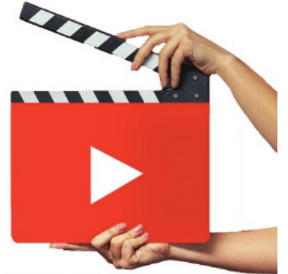
Vega Grup Yazılım